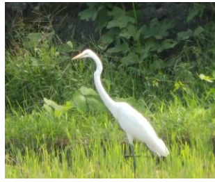
大山崎の野鳥 (チュウサギ)