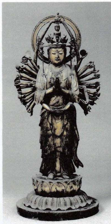
宝蔵寺千手観音像