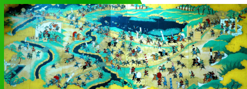
④天下分け目の天王山