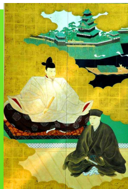
⑥秀吉の天下への道

*雨天中止 天気予報等で催行困難と判断した場合は、前日17時までにホームページに掲載します。